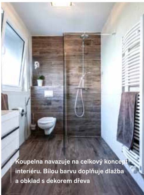
Koupelna navazuje na celkový koncept interiéru. Bílou barvu doplňuje dlažba a obklad s dekorem dřeva