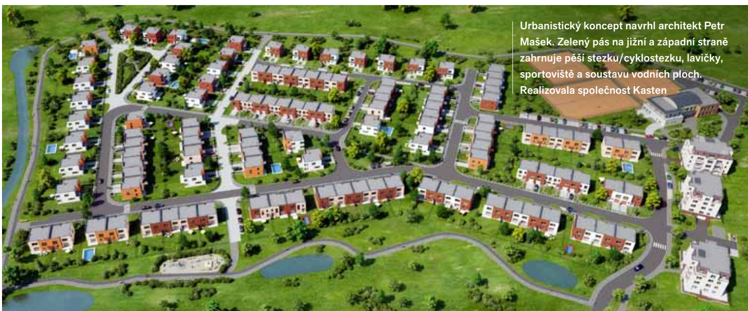
Urbanistický koncept navrhl architekt Petr Mašek. Zelený pás na jižní a západní straně zahrnuje pěší stezku/cyklostezku, lavičky, sportoviště a soustavu vodních ploch. Realizovala společnost Kasten